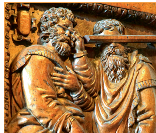
Une leçon d'humilité attribuée à Jésus dans l'Évangile selon Saint Matthieu, Saint Luc et Saint Thomas.